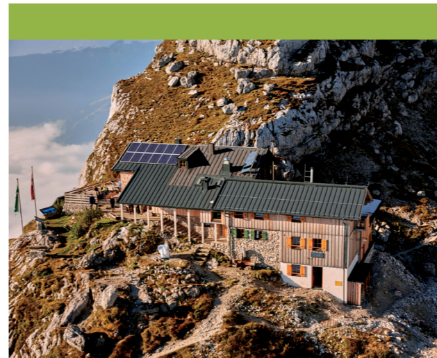
Passauer Hütte